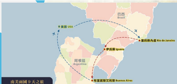
南美兩國 9 天之旅

website-www.sonictour.com CONTACT NUMBER-323-266-8988