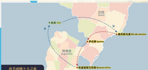
南美兩國 9 天之旅

website-www.sonictour.com CONTACT NUMBER-323-266-8988