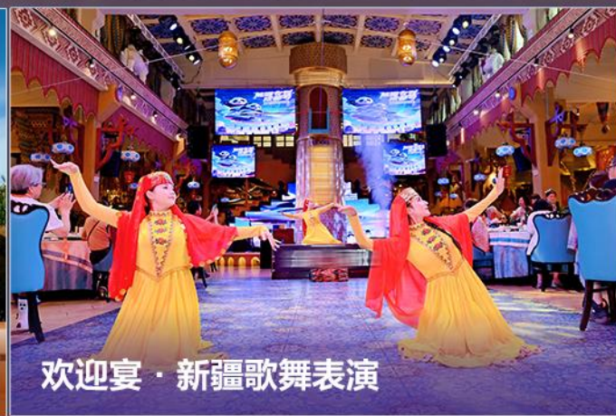
欢迎宴·新疆歌舞表演