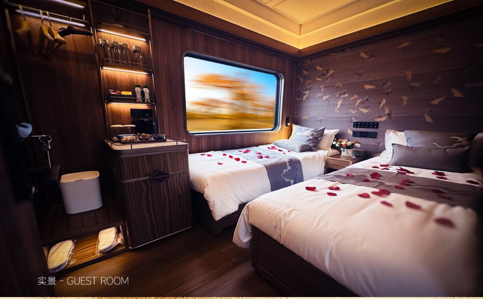
实景 - GUEST ROOM