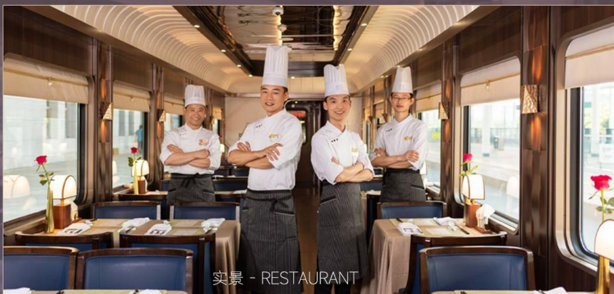
实景 - RESTAURANT

厨师团队由深耕高端餐饮领域20余年的明星主厨领衔， 汇聚来自知名烹饪学府与地域美食专家的优秀成员，为您打造以粤菜、 新川菜为主的高品质美味...尽享美食美景惬意旅途时光