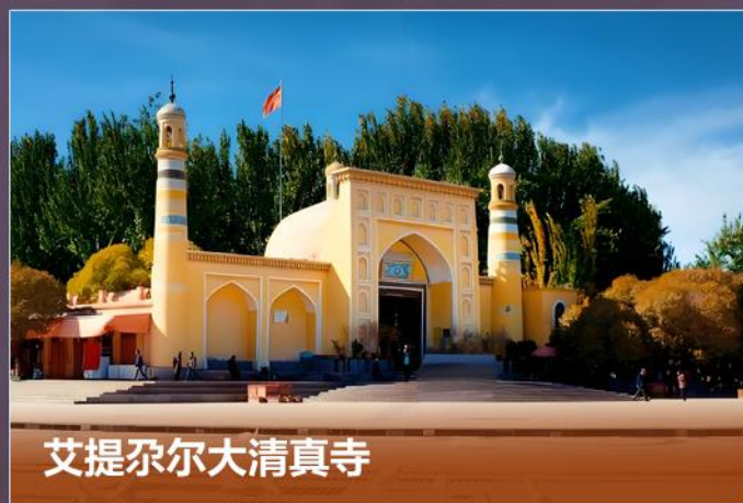
艾提尕尔大清真寺