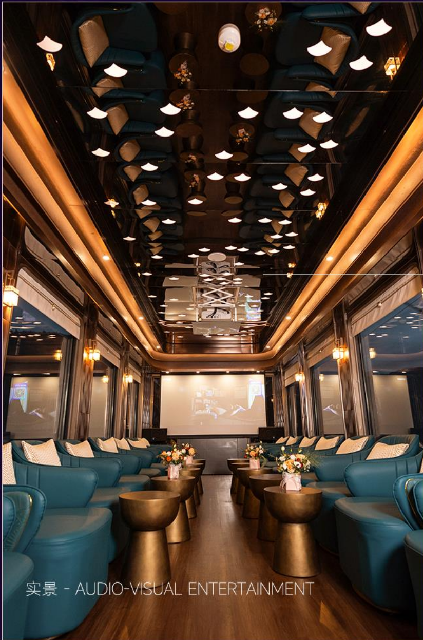
实景 - AUDIO-VISUAL ENTERTAINMENT

银杏元素贯穿始终，采用暖金色调营造出兼具自然疗愈与沉浸娱乐的梦幻空间。白天，这里是雅致的观光空间，一览超宽车窗外的壮阔风景；夜晚，车厢化身移动音影厅，梦幻星空顶点亮星芒，欢唱或观影，沉浸其中。