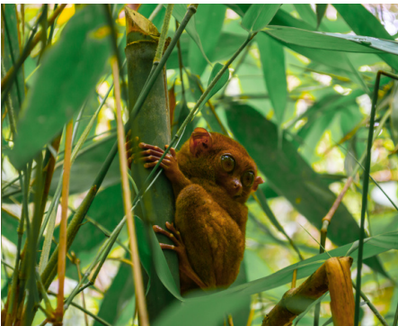
▲在叢林內尋找眼鏡猴的蹤跡