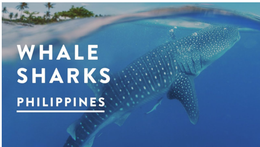
▲下水一睹海面下最巨大生物的真實面貌