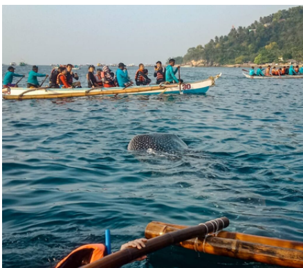
▲在螃蟹船上欣賞鯨鯊