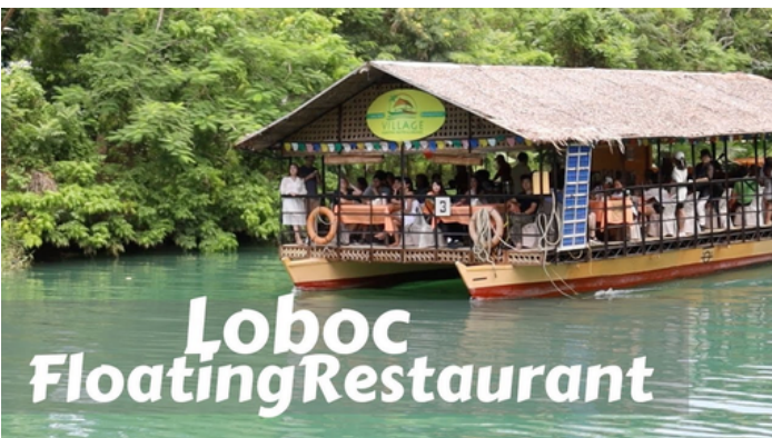
▲竹筏船屋上享用薄荷島美食